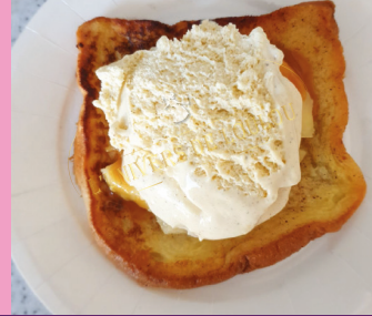
PAIN PERDU Brioché