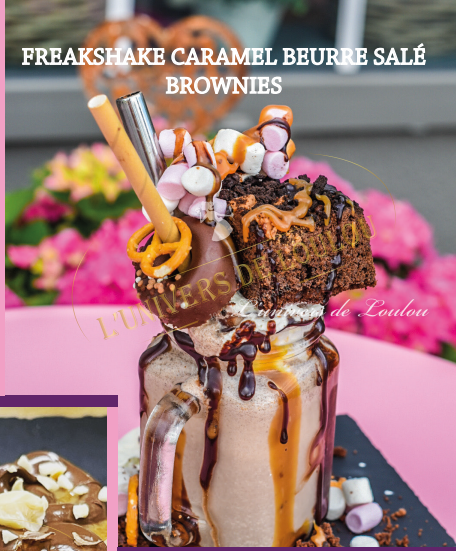
FREAKSHAKE CARAMEL BEURRE SALÉ BROWNIES