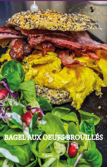
BAGEL AUX OEUF BROUILLÉS