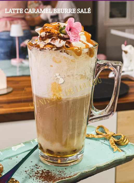
LATTE CARAMEL BEURRE SALÉ